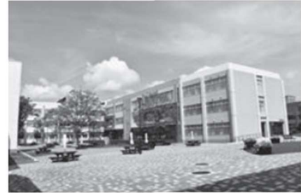
刈谷市と包括連携協定を結び様々な分野で連携している愛知教育大学

問 愛知教育大学の方々に包括連携協定を通じて、様々な場面で協力してもらっている。コロナ禍において、大学生の置かれている状況をどのように把握し、どのように感じているか。 答 日頃から同学の地域連携室と情報交換を通じて状況を聞いています。大学が独自で困窮学生支援金制度を設け、経済的影響のある学生の支援を行っていることや、休学・退学希望者が例年とほとんど変わらない状況であることから、現在、市から特別な支援を必要とする状況ではないと認識している。 問 刈谷市は高校生までに 答 刈谷市は高校生までに