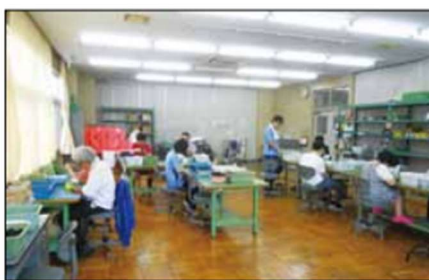
すぎな作業所で、障害者の方の生活を支援

問 新たに市長に就任し、掲げている39項目の公約は、どの点に配慮したか。 答 地域性、年齢、男女の観点からバランスを考え作成した。 問 4年間で実施する公約の工程表はいつできるのか。 答 実施計画の策定や当初予算の編成過程において各施策を取りまとめ、令和2年度初め頃までに工程表を示す予定である。 問 重点的に取り組む施策は。 答 人口減少へ人口構成が変化していく中で、子育て支援として待機児童対策や産後ケアの充実、高齢者の生活支援として見守りや相談機能の強化、在宅